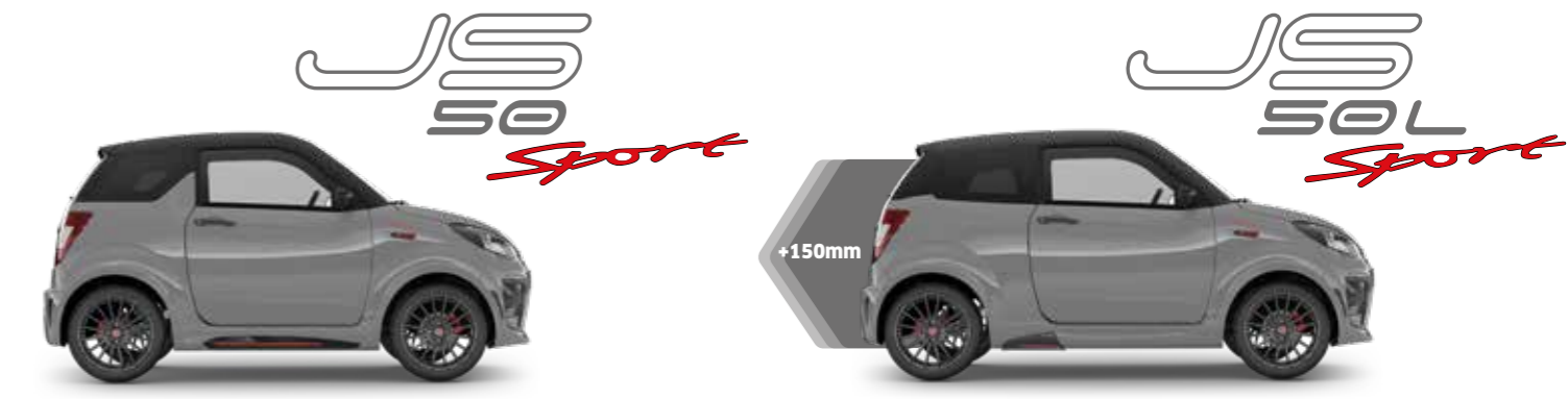
Version longue disponible uniquement sur Sport Ultimate!